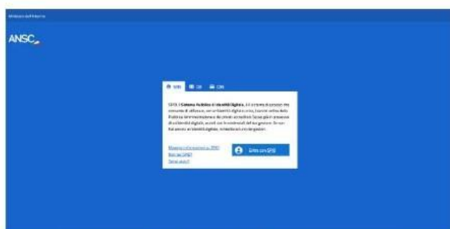
Figura 102 - Login cittadino

Nel caso il cittadino sia in possesso di una firma digitale, l'ufficiale di stato civile seleziona tale modalità di firma (vedi par. 4.7.2). In tal caso il cittadino riceverà sulla email indicata all'ufficiale di stato civile il link ad una pagina alla quale potrà accedere tramite SPID o CIE.